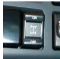
Pulsante bloccaggio differenziale di serie